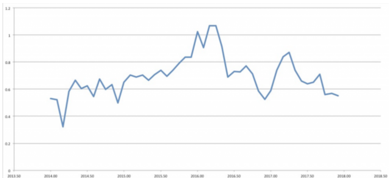
Abbildung: Die globalen Temperaturdaten von HadCRUT4 (2014 bis 2017) widerlegen die Aussage, dass die Wärme des Jahres 2017 einem Wiederaufleben der globalen Erwärmung geschuldet ist. Die Welt hat sich vielmehr abgekühlt.

Die Temperatur-Struktur des Jahres spricht dagegen. HadCRUT4 zeigt dies ziemlich eindeutig: