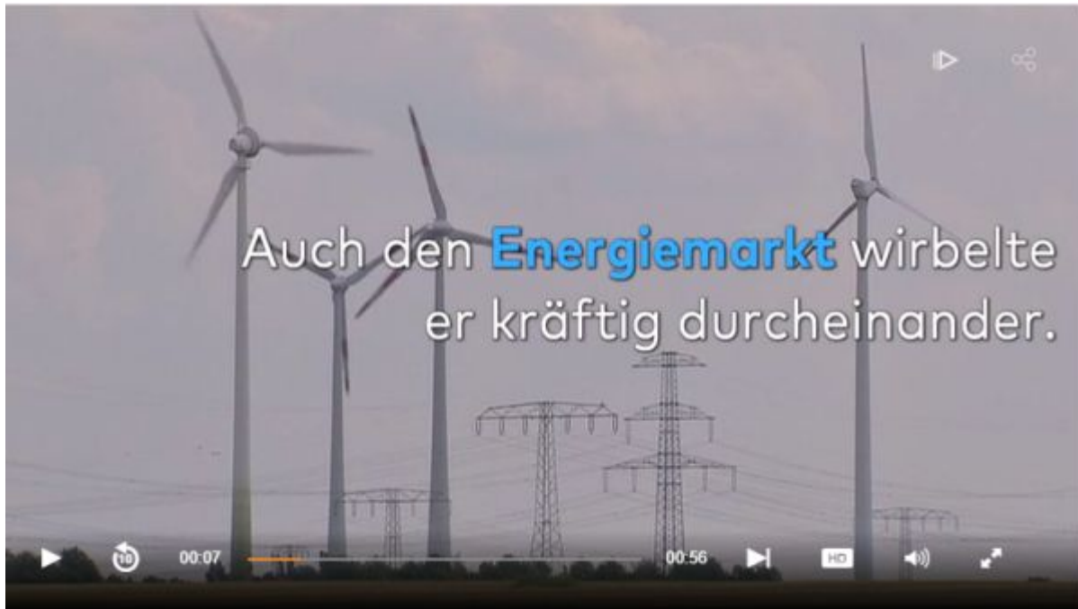
Welt-N24 screenshot des Videos