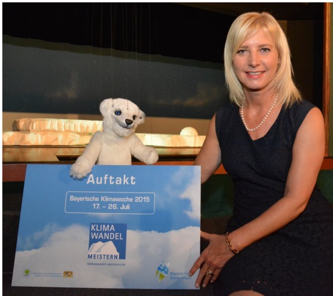
Bild Frau Ministerin Scharf eröffnet die Bayerische Klimawoche 2015.

An sich ist es jedoch unwichtig, wer die bayerische Umweltministerin befragt. Die Antworten sind sowieso immer die einer Sprechpuppe von Frau Hendricks. Wie Frau Hendricks den Klimawandel „täglich spüren kann“, so konnte ihn Frau Scharf in Bayern erweitert „mit den Händen greifen“ und nun sieht sie ihm bereits beim Arbeiten zu. Mit Halluzinationen kann man heutzutage – sofern man zum richtigen Zeitpunkt am richtigen Ort ist – entscheiden, geht man in die Klapsmühle, oder wird man damit nicht besser Umweltminister*in.