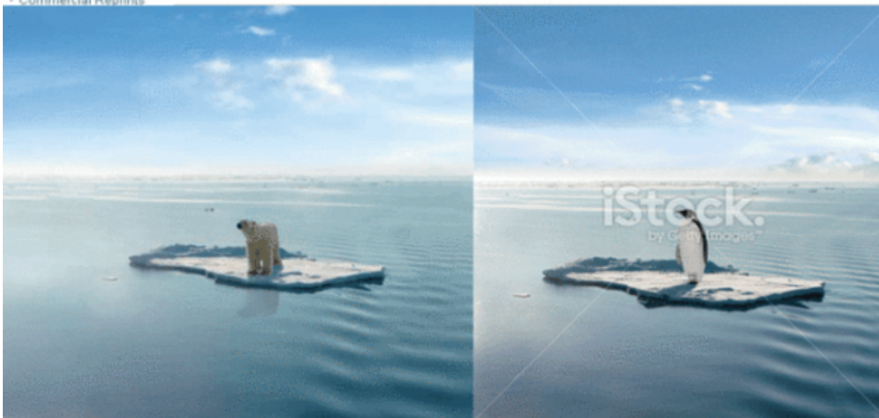
Abbildung 2: Das Fake-Bild (links) in Science, Mai 2010

Die Wirklichkeit: Die mittlere Eisausdehnung des Arktischen Meereises im September betrug während der Jahre 1996 bis 2005 6,46 Millionen km 2 . Im Zeitraum 2007 bis 2016 nahm die Fläche um 26% ab auf 4,77 Millionen km 2 ab. Trotz dieser Abnahme nahm die Eisbär-Population von einer im Jahre 2005 geschätzten Anzahl von 20.000 bis 25.000 Tieren auf 22.000 bis 31.000 Tiere geschätzt im Jahre 2015 zu. Siehe hier .