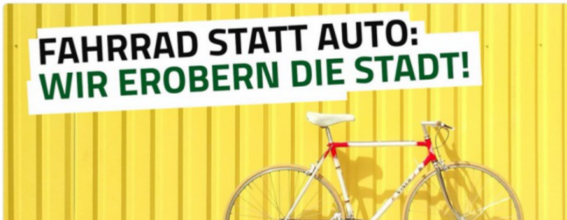
Bild: Frankfurter Allgemeine 20. Juni 2017: Grüne Verteufelung braucht keine komplexe Aufklärung

Stuttgarter Nachrichten 01. November 2017: [2] ... Rößler nannte einige Beispiele, um die bereits erstellten Rohbauten zu nutzen. Die Baugrube des unterirdischen Hauptbahnhofs könne etwa „als neuer Zentraler Omnibusbahnhof“ sein, „Tiefgarage für PKWs der Bahnreisenden“ oder „Fahrradgarage.“