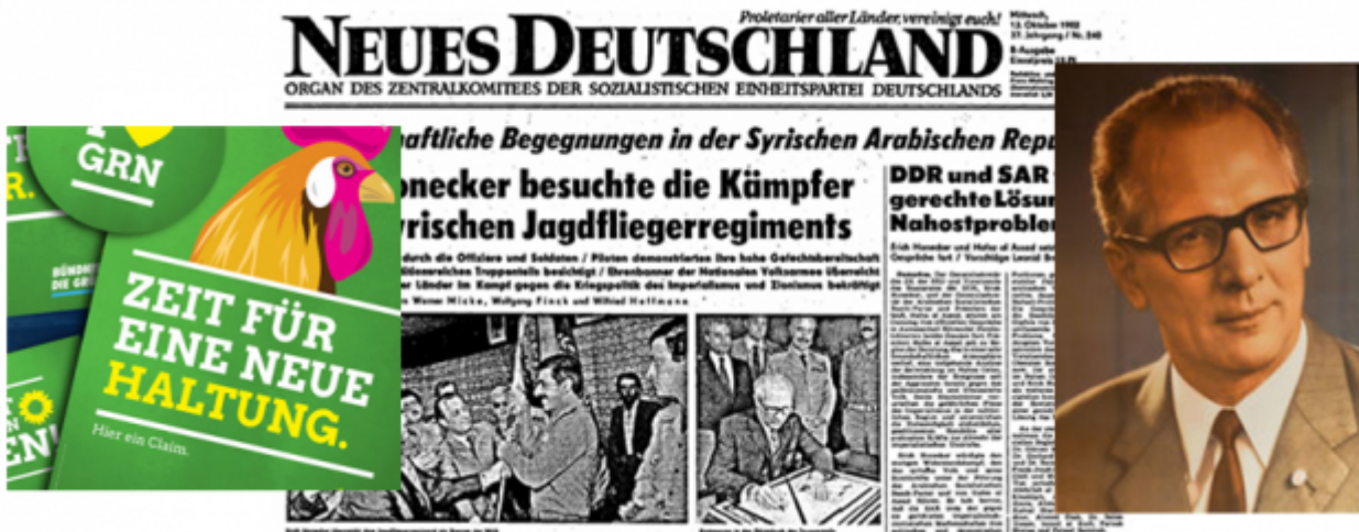
Abb.3: Kämpfer für ein Neues Deutschland. Wo das eine hinführte, durften wir leidvoll erleben. Nun gilt, verhindern wir den nächsten Versuch.

Wer hat nicht immer gegen den Diesel und die Autoindustrie, eine der Säulen unserer Wirtschaft, damit unserer Arbeitsplätze, damit unseres Wohlstands, damit der Stabilität unseres Landes, gehetzt. Na, wer wohl: Die grünen Männchen. Und geht es denen nicht darum, ein „Neues Deutschland“ zu schaffen (Abb.3) und dafür muss natürlich das alte Deutschland, unser liebgewonnenes Deutschland vernichtet und zu Grabe getragen werden. Da gab es doch mal eine Gazette, die hieß doch auch so, für wen war die denn gleich nochmal tätig, ah ja, für „unseren“ Erich (Honecker). Für wen ist denn jetzt die obige Hamburger Gazette unterwegs? Ähnlichkeiten sind dann sicherlich einzig und allein, rein zufällig.