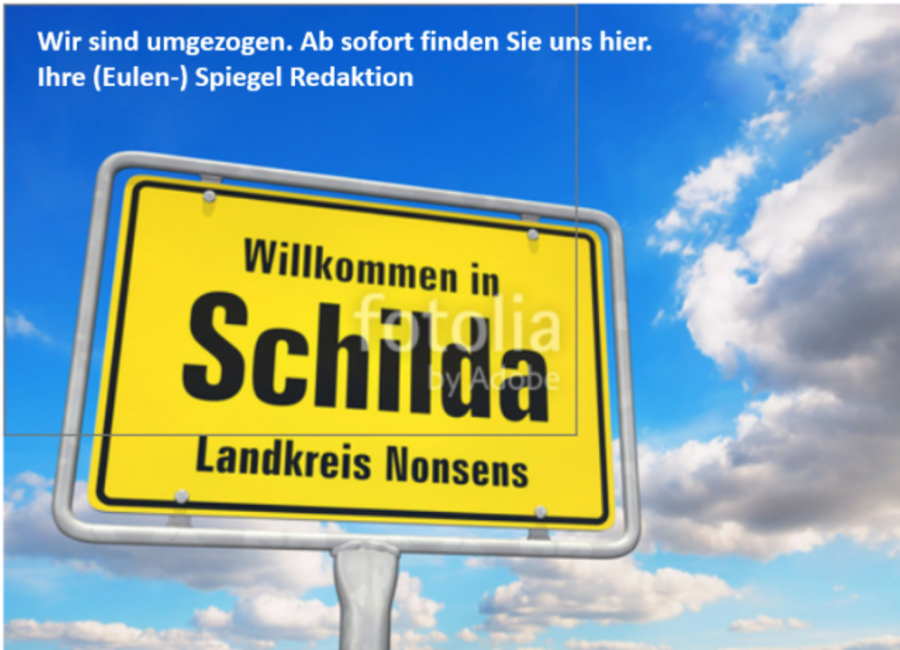
Abb.6: Mit seinem jüngsten Bericht zum Kartell (siehe auch Abb.15), hat der Spiegel gezeigt, wo er zu finden ist. Der Autor hat sich auf die Suche gemacht und ist fündig geworden. Text: Autor.

Aber, sind wir doch mal ehrlich, dem Spiegel geht es doch gar nicht um investigative Aufklärung, sondern um Unterstützung seiner grünen Männchen (der Autor kommt noch dazu) und natürlich um Auflagenstärke (Abb.7).