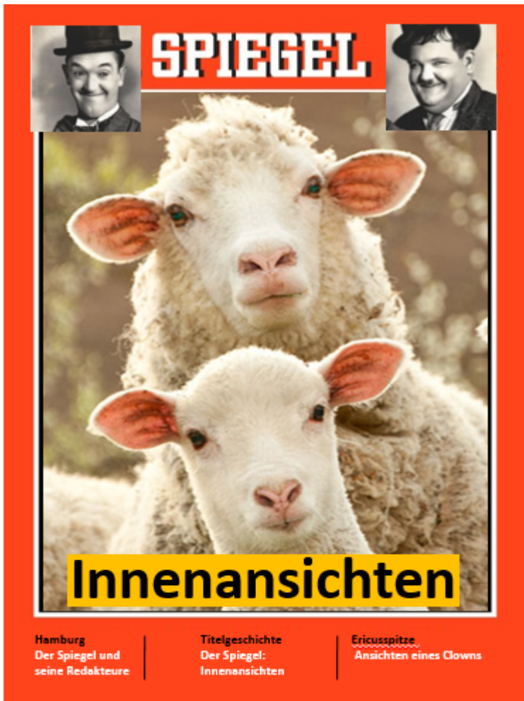
Vorschlag des Autors für die kommende Titelgeschichte beim Spiegel. Denn das „S“ im Spiegel steht sicherlich für „Schaf“ und das „l“ für „Lüge“. Die Silbe „gel“ ist dann sicherlich die Abkürzung für (wieder einmal) „gelogen“.

Bei den Herren links und rechts oben im Bild, handelt es sich nicht um Spiegel-Redakteure, sondern um Stan Laurel und Oliver Hardy, auch bekannt als Dick & Doof. Sie sollen den Comedy-Charakter des Spiegel unterstreichen.