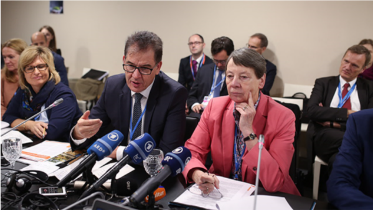
Umweltministerin Barbara Hendricks und Entwicklungsminister Gerd Müller nehmen an der UN Klimakonferenz COP22 in Marrakesch teil.

Bild Entwicklungsminister Müller und Umweltministerin Hendricks.