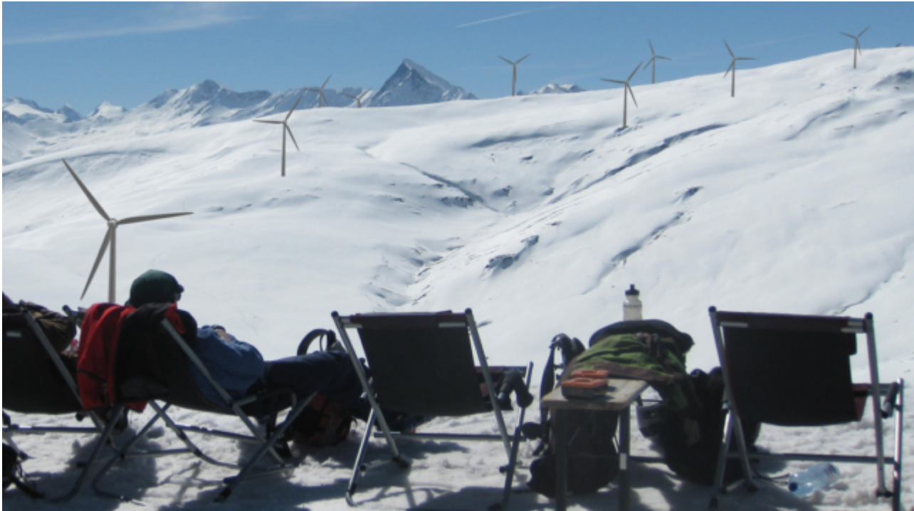
Bild 5 Geplanter Windpark Altaventa AG Schweiz. Medienbild (Auszug)

EIKE 25.03.2016: Windräder als Aussichtsplattformen sind Touristenmagnete ist dort leichter, da man nicht erst auf die Windradplattform steigen muss, sondern bequem davor relaxen kann.