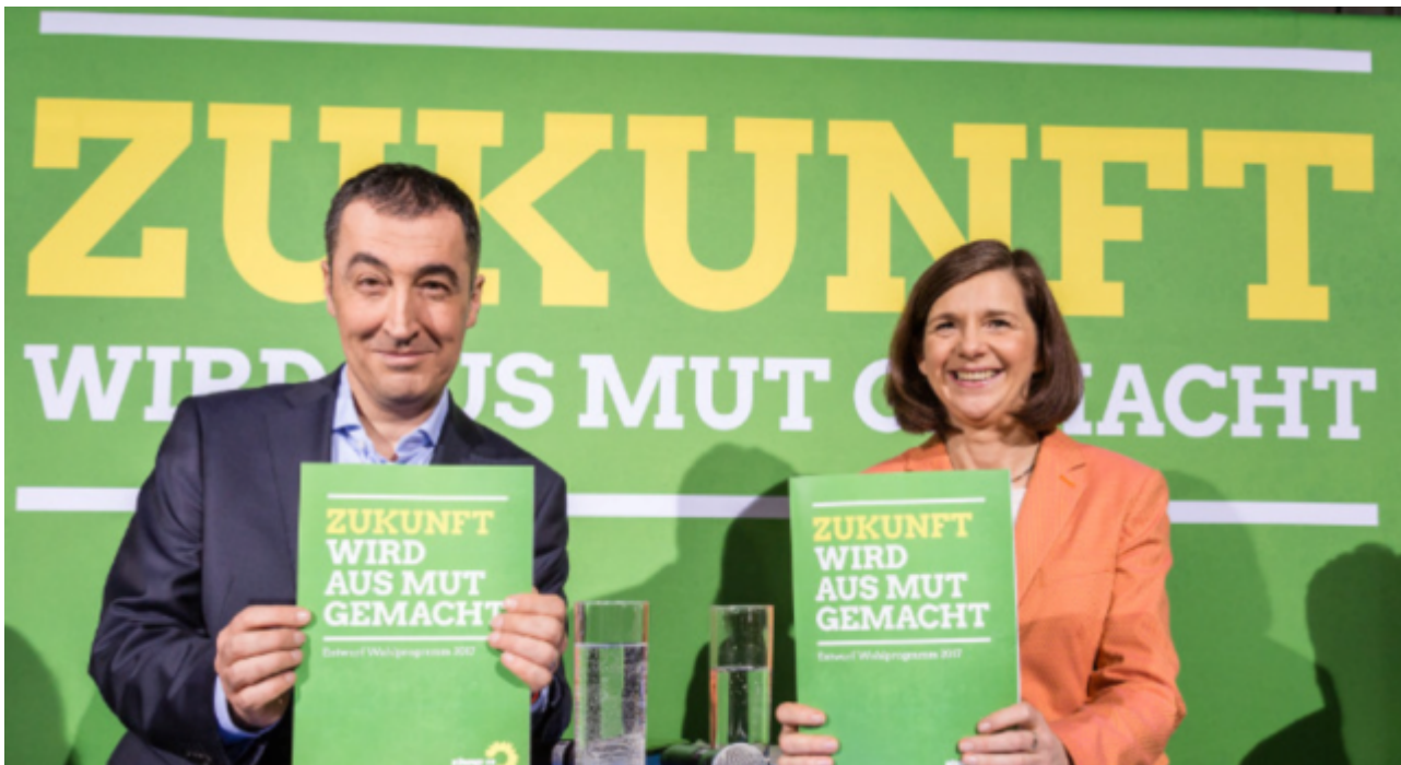
Bild 2 Wahlkampflogan 2017 der GRÜNEN

Aussage von Frau Hendricks: EIKE: In einer Zeit, die immer mehr von Unsicherheit und Ängsten geprägt ist, macht Klimaschutz Mut