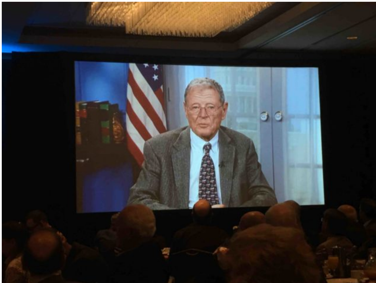
US Senator James Inhofe, bei seiner Begrüßungsrede anlässlich der 12. Heartland Klimakonferenz in Washington DC.

Den Auftakt machte ein Video-Grußwort des politischen Anführers der Klimarealisten im US Kongress, Senator James Inhofe, der ausführte, dass nun die Zeit gekommen sei, die gesetzlichen Vorgaben, sei es durch die Umweltbehörde EPA verfügte, oder durch präsidiale Erlasse von Präsident Obama aufzuheben, weil die überaus teuren, für das Klima aber völlig wirkungslosen, mithin für die Bevölkerung und das Land nutzlosen Gesetze und Verordnungen, das Vertrauen zwischen Regierung und Regierten völlig zerstört hätten. Diese Vertrauen wieder herzustellen, sei die große Aufgabe der Regierung Trump.