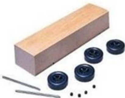
Abbildung 1: Grundbestandteile einer

Dies ist genau so, als ob man sagt, dass eine Seifenkiste eine gute Approximation eines Rolls Royce oder eines Ferrari ist. Als Beweis führen sie an, dass die Seifenkiste anscheinend einige Spuren-Charakteristika hat und der Straße in der gleichen Richtung folgt – falls sie sich auf einem Hügel befindet.