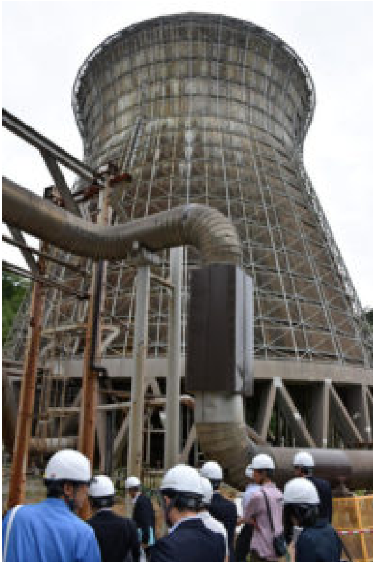
Kühlturm des Matsukawa geothermischen Kraftwerks, 46 Meter hoch.