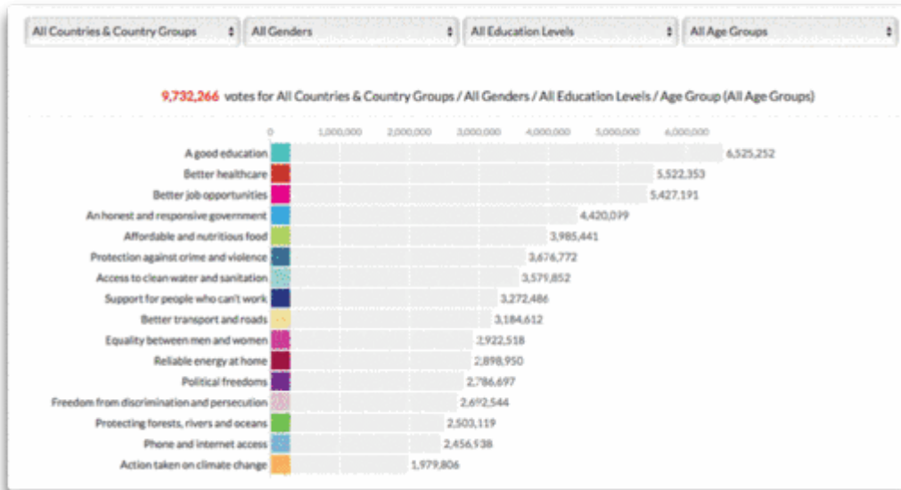
Abbildung 1: Ergebnisse der UN-Umfrage, alle gesellschaftlichen Gruppen.

Da habe ich mich entschlossen, ein wenig tiefer in diese Daten einzutauchen. Ich begann mit einem Blick auf die Unterschiede zwischen Männern und Frauen bzgl. der oben gelisteten Themenbereiche: