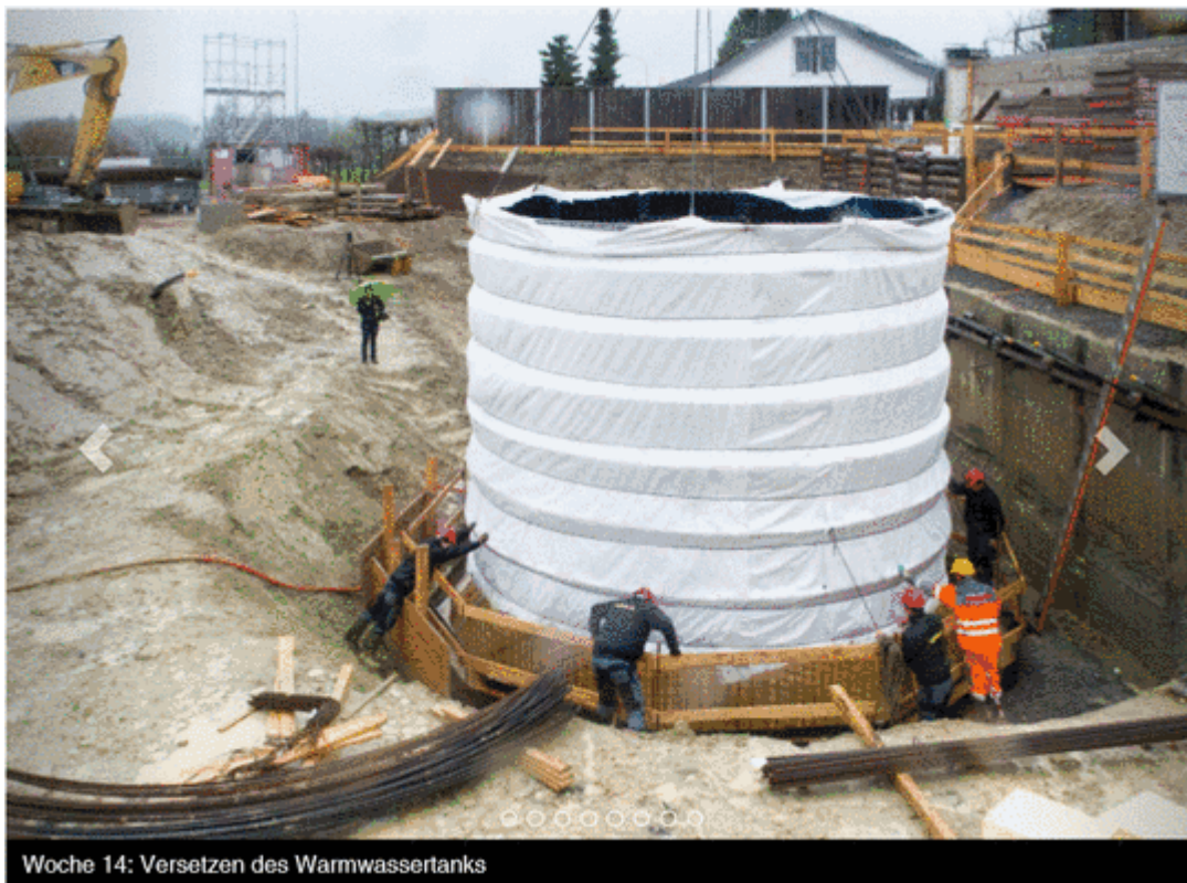
Woche 14: Versetzen des Warmwassertanks