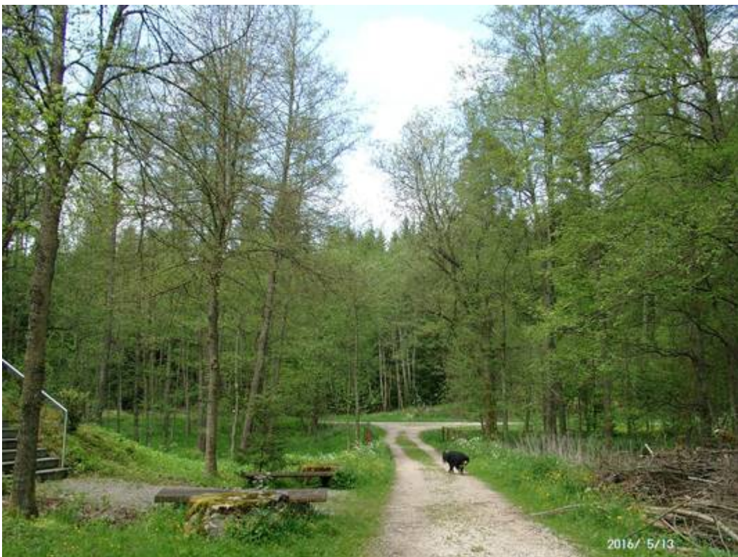
Abbildung 6: Vergleich desselben Standortes: oben 8. Mai 2015, unten 8. Mai 2016. Mitten in den Eisheiligen (11. – 15. Mai) zeigt die Vegetation Deutschlands einen deutlichen Rückstand zur Vegetation in den Städten. In Süddeutschland waren die Eisheiligen 2016 in der schönen „Pampa“ diesmal so kalt, dass die Bäume ihre weitere Begrünung kurzzeitig eingestellt haben.

Aufgrund der geschilderten Tatsachen muss der Schluss gezogen werden, dass sogenannte Treibhausgase wie Kohlendioxid entweder gar nicht treibhauswirksam