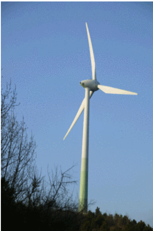
Bild 1. Die gesamte Stromversorgung der Inseln soll künftig durch Windenergieanlagen erfolgen

Das dort realisierte Projekt ist typisch für so viele Vorhaben, die von angeblich „grünbewegten“ Geschäftemachern mit reichlich zur Verfügung gestellten öffentlichen Geldern durchgezogen und von ihren Handlangern in den Medien über den grünen Klee gelobt werden. Es werden große Versprechungen gemacht, satte Förderungen eingestrichen und wunderschön anzusehende nagelneue Installationen in die Landschaft geklotzt. Der Film zeichnete die verschiedenen Stufen des Projektablaufs von der Konzeption über die einzelnen Realisierungsstufen nach und gab den Initiatoren reichlich Gelegenheit, sich und ihre Rolle bei dem Vorhaben effektiv in Szene zu setzen.