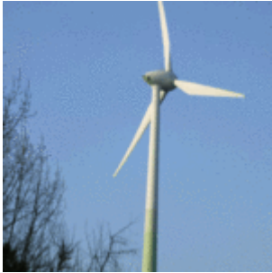
Bild rechts: Auch eine „grüne Trauminsel der Zukunft“ kann sich unversehens als Alptraum entpuppen (Symbolbild)

Das dort realisierte Projekt ist typisch für so viele Vorhaben, die von angeblich „grünbewegten“ Geschäftemachern mit reichlich zur Verfügung gestellten öffentlichen Geldern durchgezogen und von ihren Handlangern in den Medien über den grünen Klee gelobt werden. Es werden große Versprechungen gemacht, satte Förderungen eingestrichen und wunderschön anzusehende nagelneue Installationen in die Landschaft geklotzt. Der Film zeichnete die verschiedenen Stufen des Projektablaufs von der Konzeption über die einzelnen Realisierungsstufen nach und gab den Initiatoren reichlich Gelegenheit, sich und ihre Rolle bei dem Vorhaben effektiv in Szene zu setzen.