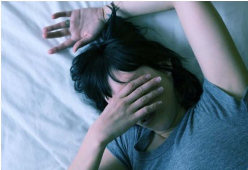
Bild: Schlaflosigkeit: Wird sie täglich durch äußere Ursachen hervorgerufen, ist es Folter.

Für all jene, die glücklich genug sind, niemals die Auswirkungen des konstanten Lärms einer industriellen Windturbine erlebt zu haben, folgt hier ein kleines Beispiel: