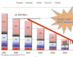
Was bringt die CO2 Reduktion dem Klima?

Während bisher vor allem das Erneuerbare Energien Gesetz (EEG) dafür sorgte, dass die Strompreise und Energie-Einsparverordnung (EnEV) dafür sorgten, dass die Mieten in den Himmels schossen, geht es jetzt mit den neuesten Gesetzentwürfen und Vorschlägen des Wirtschafts (1)- und Umwelt-Ministeriums (2) vielen weiteren Jobs an den Kragen.