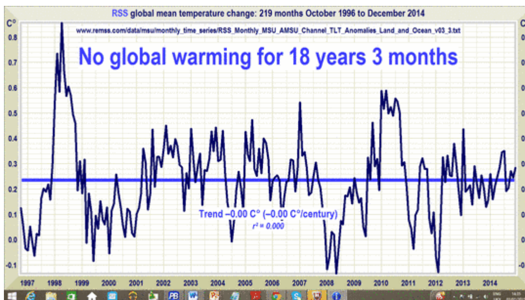
Abb. 3: Trendverlauf der globalen Mitteltemperatur nach Satellit Auswertung RSS.