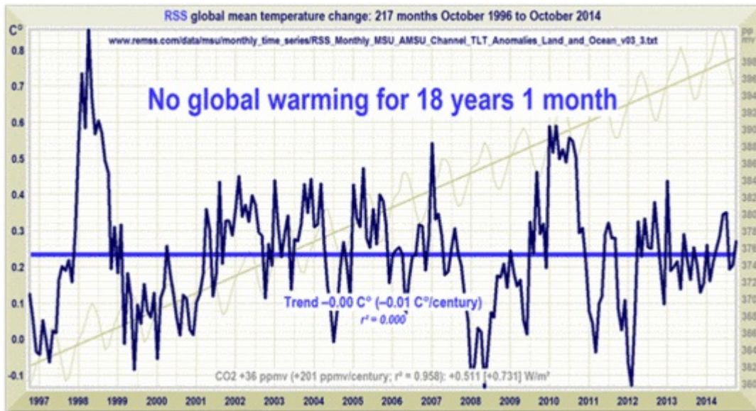
Abb. 1 Verlauf (dunkelblau) und Trend (hellblau) der globalen Mitteltemperatur aufgezeichnet vom Satellitenauswerter RSS, mit hinterlegtem Verlauf (hellgrau) und Trend (dunkelgrau) der globalen CO2 Konzentration

noch so klitzekleine Erwärmung, eher eine kleine , wenn auch winzige, Abkühlung.