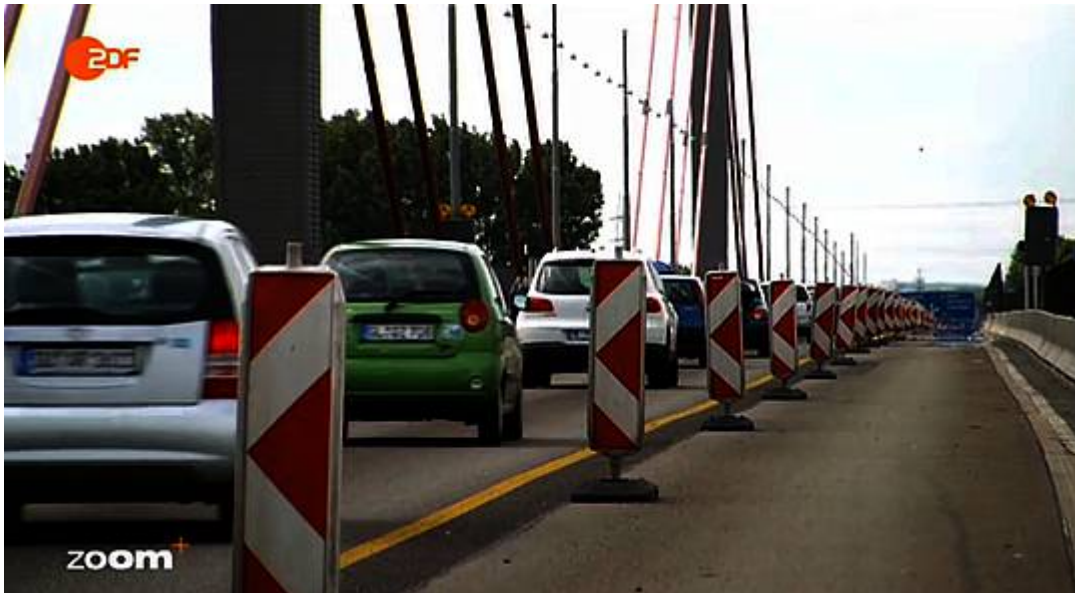
Abb. 3 Eine von zahlreichen aber immer noch viel zuwenig Baustellen auf Deutschlands Brücken. Sehenswerte Details hier

Obwohl jetzt schon fast 2/3 der Unternehmen ihre Geschäftstätigkeit durch die marode Verkehrsinfrastruktur beeinträchtigt sehen.