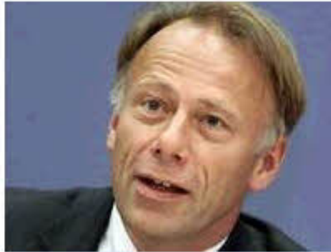
Trittin macht erneuerbare Energien als Sündenbock bei Stromversorgern aus.

Bundesumweltminister Jürgen Trittin hat die Energieversorger wegen wiederholter Erhöhungen der Strompreise scharf angegriffen. "Wenn einzelne Stromkonzerne zum wiederholten Mal ihre Strompreiserhöhungen auf die Förderung der erneuerbaren Energien schieben, dann ist das reine Abzockerei", sagte Trittin der "Bild am Sonntag". "Tatsache ist, dass im letzten Jahr nicht mehr erneuerbarer Strom eingespeist wurde als 2002".