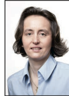
Beatrix von Storch Vorsitzende des Vereins Zivile Koalition e.V.