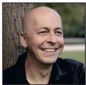
Oliver Janich Bundesvorsitzender der Partei der Vernunft