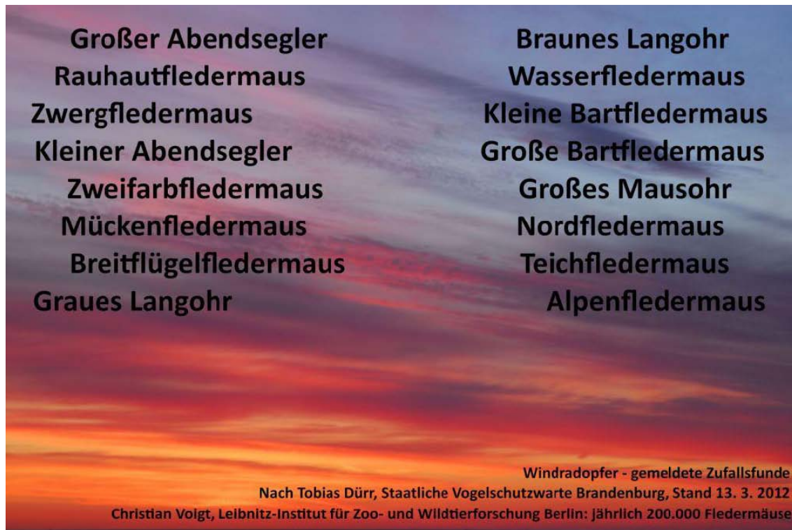
Bild 7: Fast alle Arten von Fledermäusen werden Opfer von Windrädern, darunter viele ziehende Fledermäuse aus Ost-Europa

Selbst den 180 km/h schnellen Mauersegler erschlagen die Rotoren.