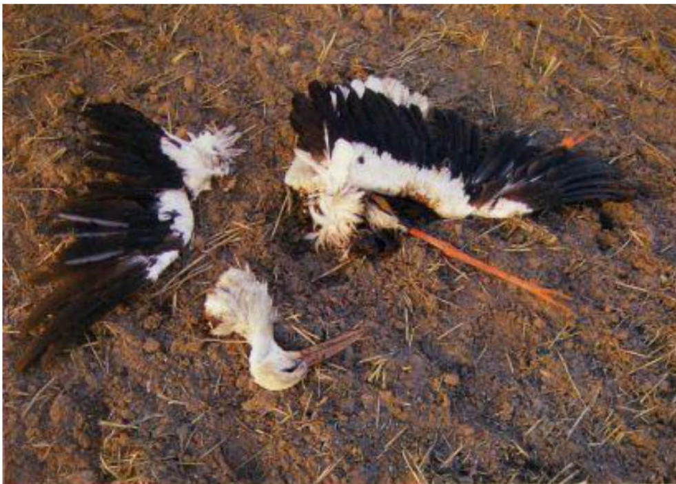
Bild 3: Echte „Schlagopfer“ weisen häufig schwere Frakturen oder gar eine Zerteilung des Rumpfes auf, wie hier bei einem Weißstorch, dessen Einzelteile am Fundort zusammengesucht wurden.

Werden Tiere von einem Rotorblatt direkt getroffen, ist es erst recht um sie geschehen und die Wahrscheinlichkeit dafür ist groß. Denn jedes einzelne Rotorblatt wiegt 3,5 t und mehr und alle paar Sekunden kommt das Nächste mit einer Geschwindigkeit von bis zu 100 Metern pro Sekunde herangerast und wieder und wieder eines. Das ist der sprichwörtliche Kampf gegen Windmühlenflügel, den jeder Vogel und jede Fledermaus verliert.