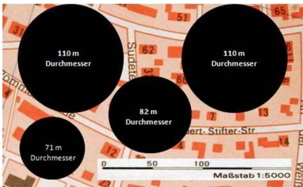
Bild 4: Auf den Stadtplan sind diejenigen Flächen projiziert, welche die Rotorblätter überstreichen. So groß sind die senkrecht stehenden tödlichen

Auch da täuschen wir uns gewaltig. Bei einem Durchmesser des Windrades von 72 Metern werden 4.000 Quadratmeter überstrichen und zur tödlichen, senkrecht stehenden Sperrzone im Luftraum. Die drei Windräder auf dem obigen Foto sperren dort zusammen den Luftraum auf einer Fläche von rund 15.000 Quadratmetern, was etwa 48 Baugrundstücken à 400 m 2 entspricht. Dazu kommen die Turbulenzonen, die die Sperrfläche noch größer machen. Ich habe selbst gesehen, wie eine Feldlerche trällernd neben einem dieser Windräder aufstieg und deutlich oberhalb des Rotors offenbar in die Turbulenzen geriet und weggeschleudert wurde. Hier sieht man in einem Video wie ein Geier vom Windrad erschlagen wird. Inzwischen drehen sich in Deutschland über 21.600 Windräder und jetzt soll es mit dem Bau von noch größeren und noch höheren erst richtig los gehen. General Electric will Windräder mit Rotordurchmessern von 110 Metern in unseren Wäldern aufstellen und plant noch größere. An der Spitze liegt Vestas, deren Windrad-Rotoren für die Nordsee 250 Metern Durchmesser haben. Jeder davon überstreicht die kaum vorstellbare Kreisfläche von 49.000 Quadratmetern (= 4,9 Hektar oder 122 Baugrundstücke à 400 m 2 ) und macht sie zur tödlichen Sperrzone für alles, was fliegt. Verglichen mit den Windrädern sind die kriminellen Vogeljäger im Süden Europas nur harmlose Lausbuben.