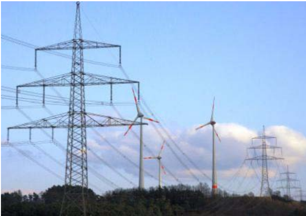
Bild 9. Mit neuer Technik sollen 380 KV-Leitungen doppelt so viel Strom transportieren und sich dabei auf bis zu 210 °C erhitzen. Das wären dann elektrische Heizdrähte quer durch Deutschland. Und was ist mit den Vögeln, die sich auf die heißen Drähte setzen?

Das Stromnetz in Deutschland ist nicht für den Transport von Wind- und Solarstrom ausgelegt. Deshalb müssen viele Tausend Kilometer neue Fernleitungen gebaut werden. Doch gegen die gibt es massiven Widerstand und der Bau würde viele Jahre dauern. Aber man könnte die vorhandenen Fernleitungen so umbauen, dass sie doppelt so viel Strom leiten können. Das geht mit den derzeitigen Leiterseilen („Stromdrähten“) deshalb nicht, weil sie sich erwärmen und ausdehnen. Sie hängen durch und zwar umso tiefer, je mehr Strom durch geleitet wird und spätestens bei 80 °C ist Schluss.