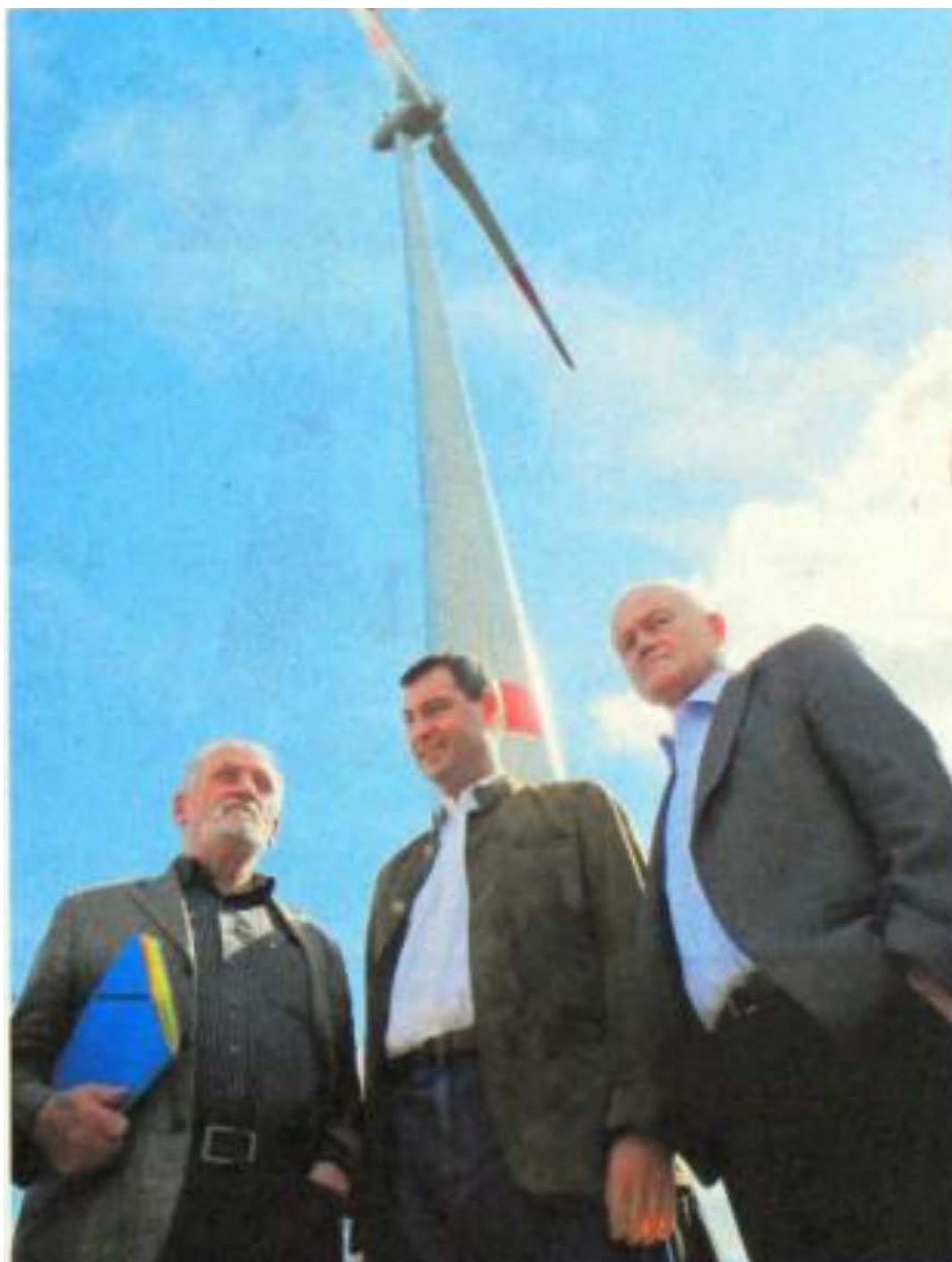
Bild 13: Unterm Windrad vereint: DNR-Präsident Hubert Weinzierl (l),

In diese Lage haben uns die Spitzenfunktionäre der Natur- und Umweltschutzverbände manövriert und das merken immer mehr Mitglieder, Ehrenamtliche und Spender. Die Funktionäre müssten ihren Irrtum einsehen und das Ruder herumwerfen. Sie tun aber das Gegenteil. Hubert Weinzierl ist der Präsident des Deutschen Naturschutzringes (DNR), der Dachorganisation von rund 100 Umweltschutzverbänden. Anfang September 2011 kommt er zur feierlichen Einweihung eines 3-Megawatt-Windrades. Es wurde mitten in einen Wald betoniert, der dafür auf 10.000 m 2 gerodet wurde. Einwände von Anwohnern und lokalen Vogelschützern wurden weggewischt. Für den BUND-Vorsitzenden Hubert Weiger erscheint Sebastian Schönauer vom Bund Naturschutz Bayern als sein Vertreter. Der NABU und der Bayerischen Landesbund für Vogelschutz ist mit Ludwig Sothmann hochkarätig vertreten.