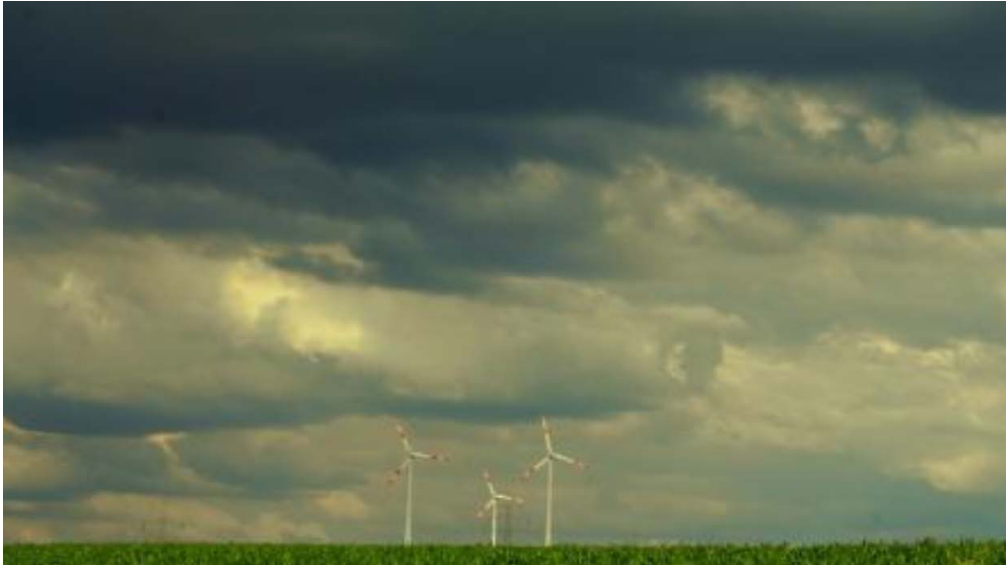
Bild 1: Die friedliche Idylle täuscht. Windräder töten Vögel und Fledermäuse, gefährden Spaziergänger und machen krank. Sie ruinieren unsere Kulturlandschaft, entwerten Grund und Boden, verteuern den Strom und bringen friedliche Bürger gegeneinander auf. Sie sind Symbole des Versagens der Naturschutzverbände und der Politik.

Vogelfreunde behaupten, Eisbomben verschießen und Symbole des Versagens der Naturschutzverbände sein?