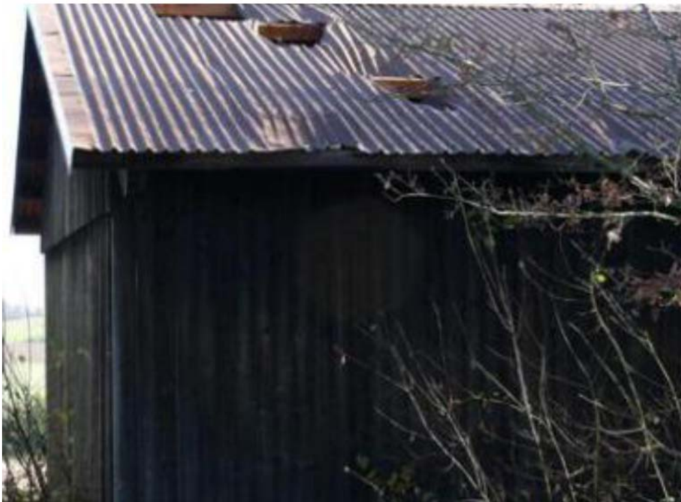
Bild 10: Eisgeschosse von einem 130 Meter entfernten Windrad haben drei Löcher in das Blechdach geschlagen. Ein Schädeldach wurde zum Glück nicht getroffen

Großen kennen wir den Effekt von den Tiefdruckgebieten. Das Wetter trübt sich ein, Wolken ziehen auf, es regnet oder schneit, denn bei fallendem Luftdruck kondensiert das Wasser, das in der Luft unsichtbar gelöst ist, zu Tröpfchen. Die sehen wir als Nebel oder Wolken. Vergleichbares löst der Unterdruck an den Rotoren aus. Die Wassertröpfchen aber können gefrieren und sich an den Rotorblättern als Eiskrusten festsetzen. Das Risiko besteht das ganze Jahr über, besonders aber bei Nebel oder trübem Wetter um null Grad, aber auch bei Temperaturen über Null. Nach und nach werden die Eiskrusten dicker und schwerer. Zugleich zerren Fliehkräfte an ihnen und irgendwann lösen sie sich und schießen als Eisplatten wie Geschosse mit bis zu 400 km/h davon. Ihre Reichweite hängt von der jeweiligen Stellung des Rotorblattes und seiner Radialgeschwindigkeit zum Zeitpunkt der Ablösung ab. Deshalb können die Eisgeschosse unmittelbar am Turm einschlagen. Sie können aber auch an jedem anderen Punkt in einem Umkreis von einigen hundert Metern um das Windrad herum einschlagen, wobei der Wind sie zusätzlich ablenkt. Der TÜV Nord kommt in einer Untersuchung auf 600 m Reichweite. Und so können die Folgen aussehen: