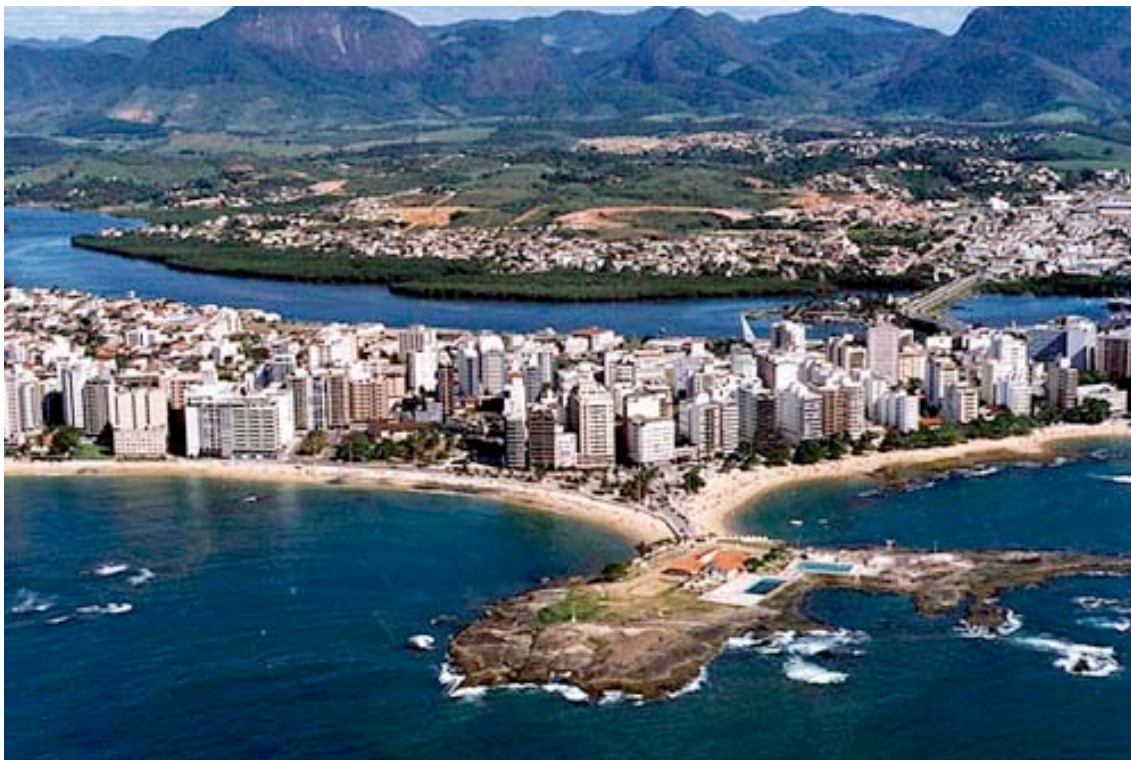
Bild 2: Todeszone Guarapari. Die Strahlung in dieser Stadt ist 17 mal so hoch wie in den evakuierten Ortschaften der Präfektur Fukushima.

Würde man dasselbe Dosimeter in der Stadt Guarapari in Brasilien aufstellen, würde es etwa 20 \mu\text{Sv/h} anzeigen, also etwa die 17 fach höhere Radioaktivität von Fukushima ( hier und hier ). Guarapari hat etwas über 100'000 Einwohner. Das sind etwa so viele wie sie aus der Region von Fukushima evakuiert wurden. Die Stadt erhielt diese hohe radioaktive Strahlung aber nicht durch einen katastrophalen Unfall, sondern durch natürliche Quellen.