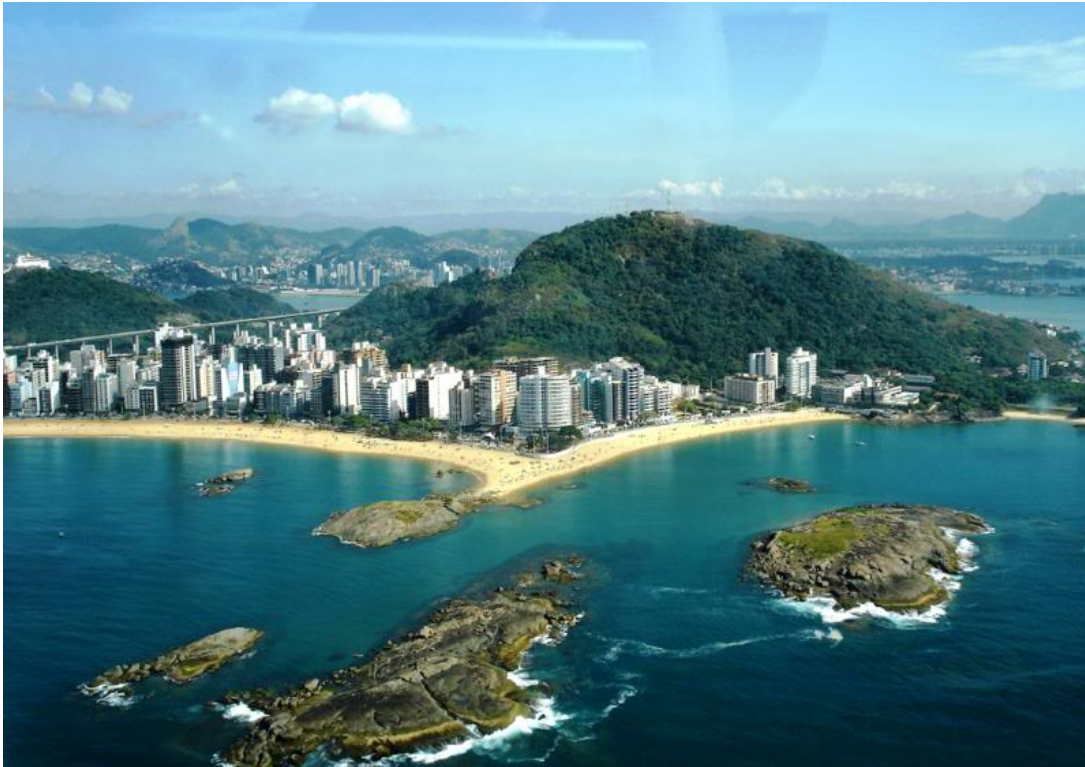
Bild 3: Guarapari, bald eine Geisterstadt. Die brasilianische Regierung lässt die Stadt wahrscheinlich schleunigst räumen.

Ein Bewohner von Guarapari äußerte sich gegenüber Kerngedanken : „Ich habe gar nicht gewusst, in welcher Todesfalle ich lebe. Jetzt möchte ich nichts wie weg hier.“ Ein anderer: „Jetzt weiß ich endlich wieso mein 98-jähriger Großvater sterben musste.“