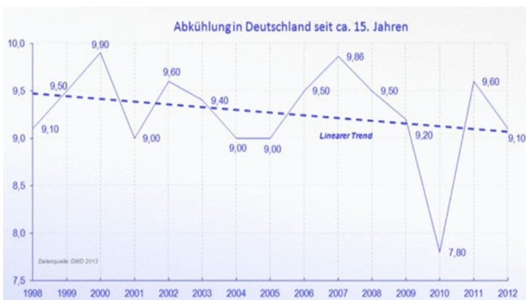
Abbildung 3 zeigt den Temperaturverlauf in Deutschland, nach Daten des DWD, wie EIKE ihn jüngst veröffentlichte

Abbildung 2 deckt sich übrigens in bester Übereinstimmung mit den ausgewiesenen Deutschlandtemperaturen des DWD, die ebenfalls im genannten Zeitraum nicht gestiegen, sondern im Gleichklang zu den Temperaturen in Erfurt, deutlich gefallen sind (Abbildung 3).