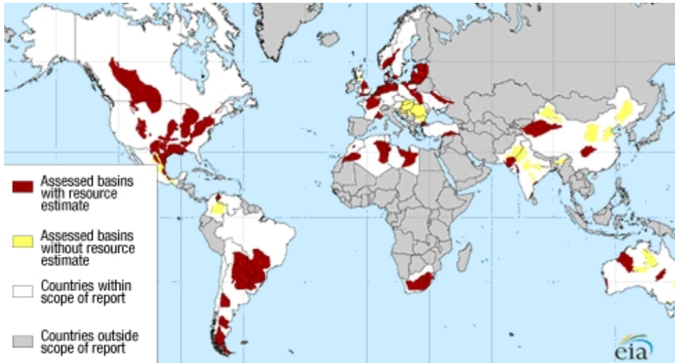
Karte 1.

Aber sogar der Bericht des EIA selbst zeigt lediglich eine zurückhaltende Schätzung, denn es fehlen einige grundlegende potentiell maßgebliche Beteiligte. Wenn die Karte 1 oben allein die verfügbaren Energiereserven verändert, dann müsste man diese Angaben erheblich nach oben erweitern, wenn es gelänge, andere große Lieferanten von Schiefer wie z. B. Russland, Indien und besonders China mit zu berücksichtigen. Siehe hier: