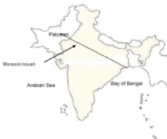
Abbildung 2: Umrisskarte von Indien und Pakistan mit der mittleren Position der monsunalen Trogachse.

Das El Niño – Ereignis im Jahre 2009, der zu einem der mildesten Winter in Kanada führte, ging im Frühjahr 2010 zu Ende. Im Juni 2010 entwickelte sich im äquatorialen Pazifik eine La Niña – Situation (Kaltphase der ENSO) die sich Anfang Juli verstärkte. Folgerichtig zeigte sich die Konvektion über dem Golf von Bengalen deutlich verstärkt, und zahlreiche Monsuntiefs [monsoon depressions] unterstützten die monsunale Strömung in den nordwestlichen indischen Subkontinent. In der dritten Woche des Juli 2010 unterstützte ein persistentes Tiefdruckgebiet über dem Teilstaat Rajasthan in Nordwestindien zusätzlich den Feuchtetransport bis nach Nordwestpakistan, was zu den schweren Regenfällen und Überschwemmungen dort führte. Nach den jüngsten Statistiken (bis zum 25. August 2010) des Indian Meteorological Department erreichte die jahreszeitliche Regenmenge in den Teilstaaten in Nordwestindien schon jetzt über 125% des Mittelwertes.